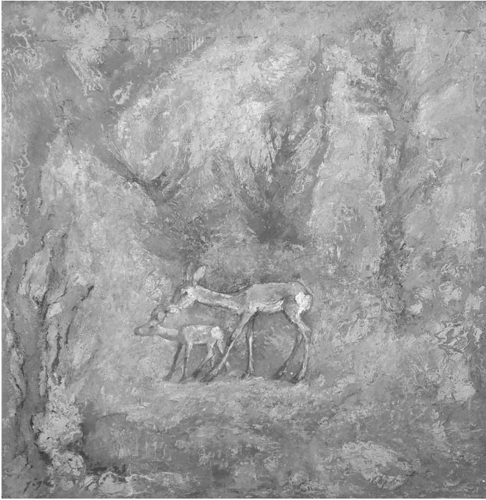
Sin título Técnica mixta 1947