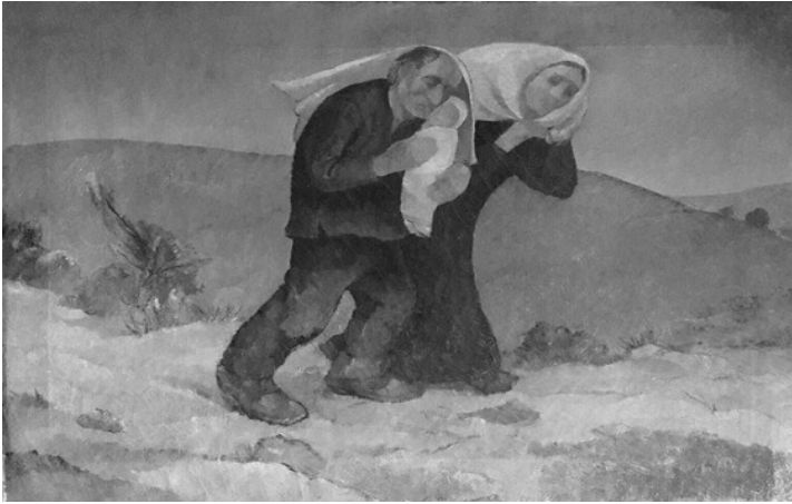
Il vento Óleo 1928