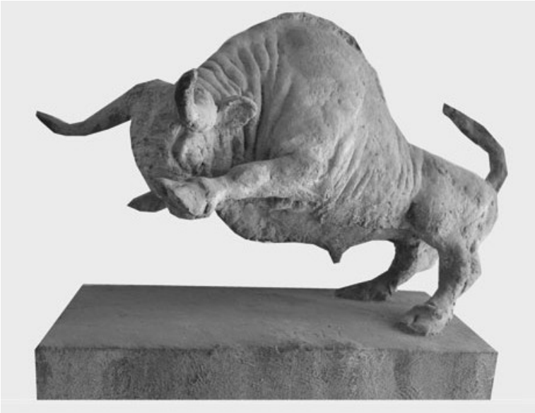
Bisonte Cemento 1970