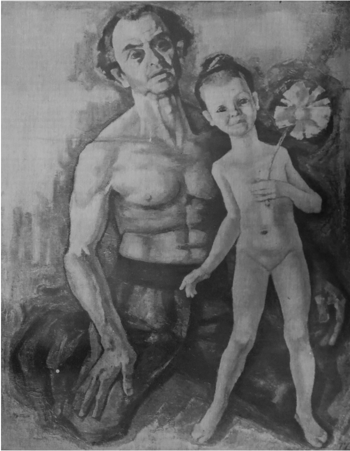
El pintor y su nieta