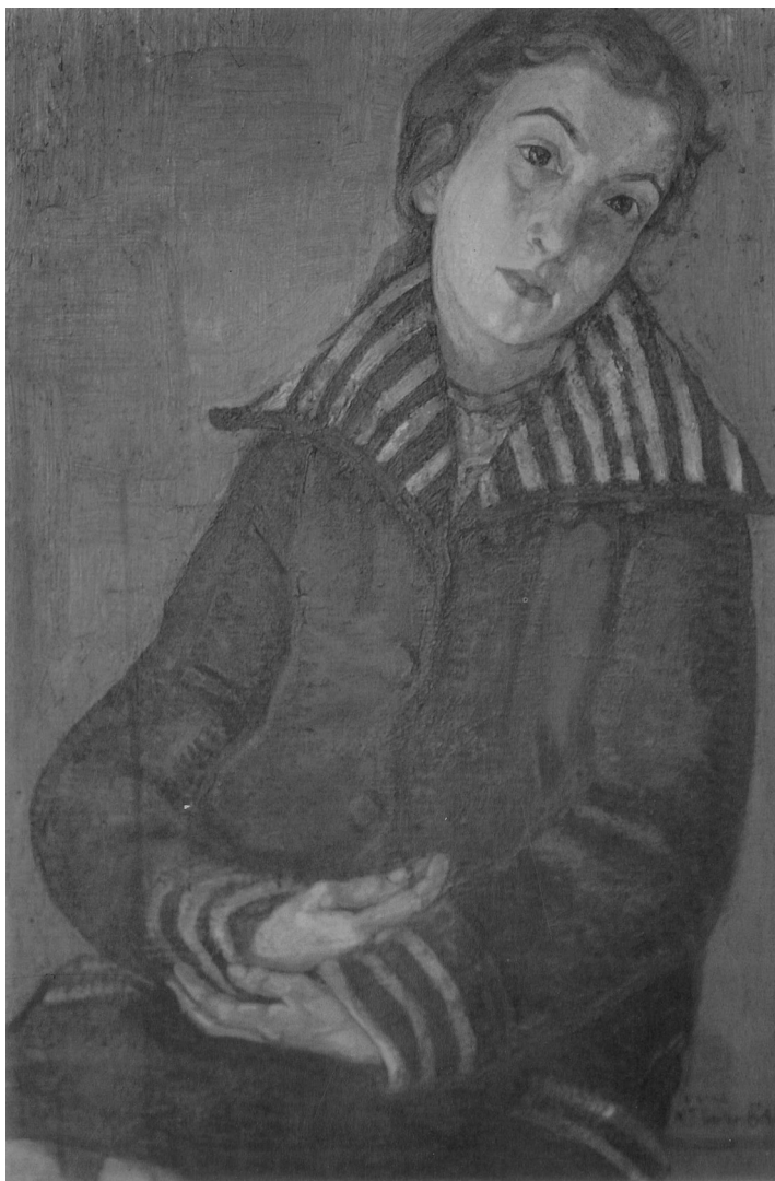
Ritratto di Fanciulla Óleo Maria Teresa Valeiras 1926